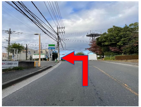
② ファミリーマート